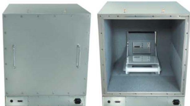
保守用背面パネル取り外し時