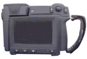
高機能形態熱画像カメラ CPA-T620/CPZ-6T45 FLIR

素子数:640×480ピクセル 測定視野角:25°×19° 可視カメラ:500万画素 測定温度範囲:-40~2000℃