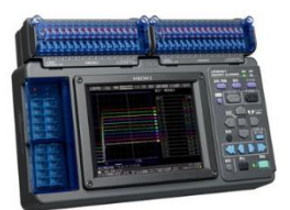
メモリアイロガー LR8401 日置電機

周波数帯域:30MHz ピーク電流:1200A 感度:5mV/A コイル長:約80mm