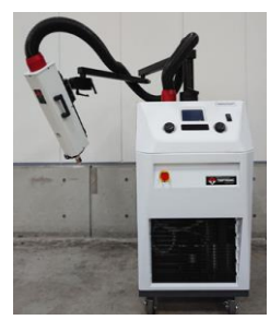
サーモストリーム ATS-545-M TEMPTRONIC 温度範囲:-75~+225℃