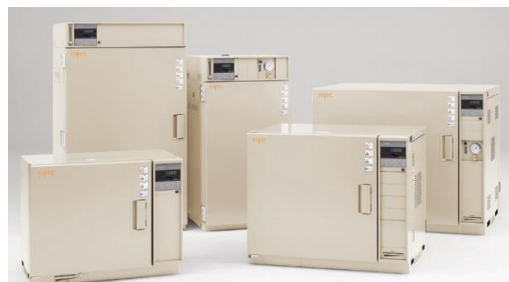
恒温器 パーフェクトオープン Esベック 温度範囲:+200℃/+200℃