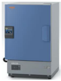
ライトスベック恒温恒湿器 LHUシリーズ Esベック 温度範囲:-20~+85℃ 入力電源:AC100V1φ

ユニバーサルユニット×2 アナログ、入力:標準30ch 押しボタン式端子台×30ch 測定対象:電圧,熱電対,抵抗