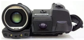
高機能形態熱画像カメラ CPA-T630SC FLIR

他の計測器も続々入荷中！ 掲載されていないモデルのご用意もございます。お問い合わせください。