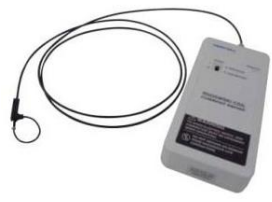
ロゴスキーコイル電流プローブ SS-286A 岩崎通信機

素子数:640×480ピクセル 測定視野角:25°×19° 可視カメラ:500万画素 測定温度範囲:-40~650℃