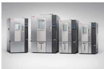
恒温恒湿器 プラチナス J シリーズ エスバック 温度範囲:-40~+100℃