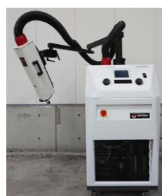
サーモストリム ATS-545-M TEMPTRONIC 温度範囲:-75~+225℃