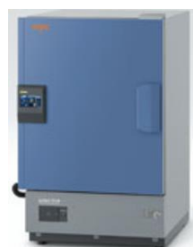
ライトスペック恒温恒湿器 LHUシリーズ エスバック 温度範囲:-20~+85℃ 入力電源:AC100V1φ