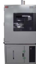
低温恒温恒湿器 NEOシリーズ エタック 温度範囲:-40℃~+100℃