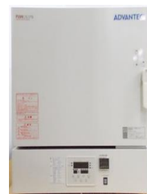
電気マッフル炉 FFW263PB /FU000191 東洋製作所 温度範囲:100℃~1,150℃