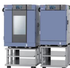
小型環境試験器 SHシリーズ エスバック 温度範囲:-40℃~+150℃