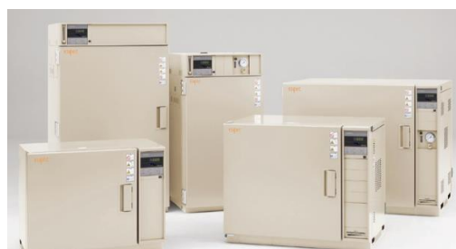
恒温器 パーフェクトオープン エスバック 温度範囲:+200℃/+200℃