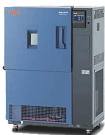
小型超低温恒温器 MC-712 エスバック 温度範囲:-75~+100℃

他の環境試験機も続々入荷中！ 掲載されていないモデルのご用意もございます。お問い合わせください。