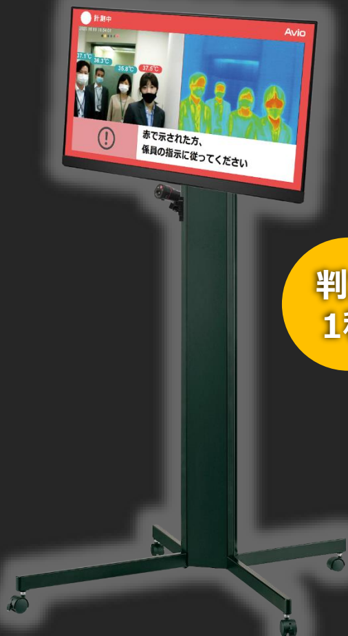
スタンドとの組み合わせは一例です

セルフチェックでも ウォークスルーでも 受付からイベントまで これ1台で発熱者対策！